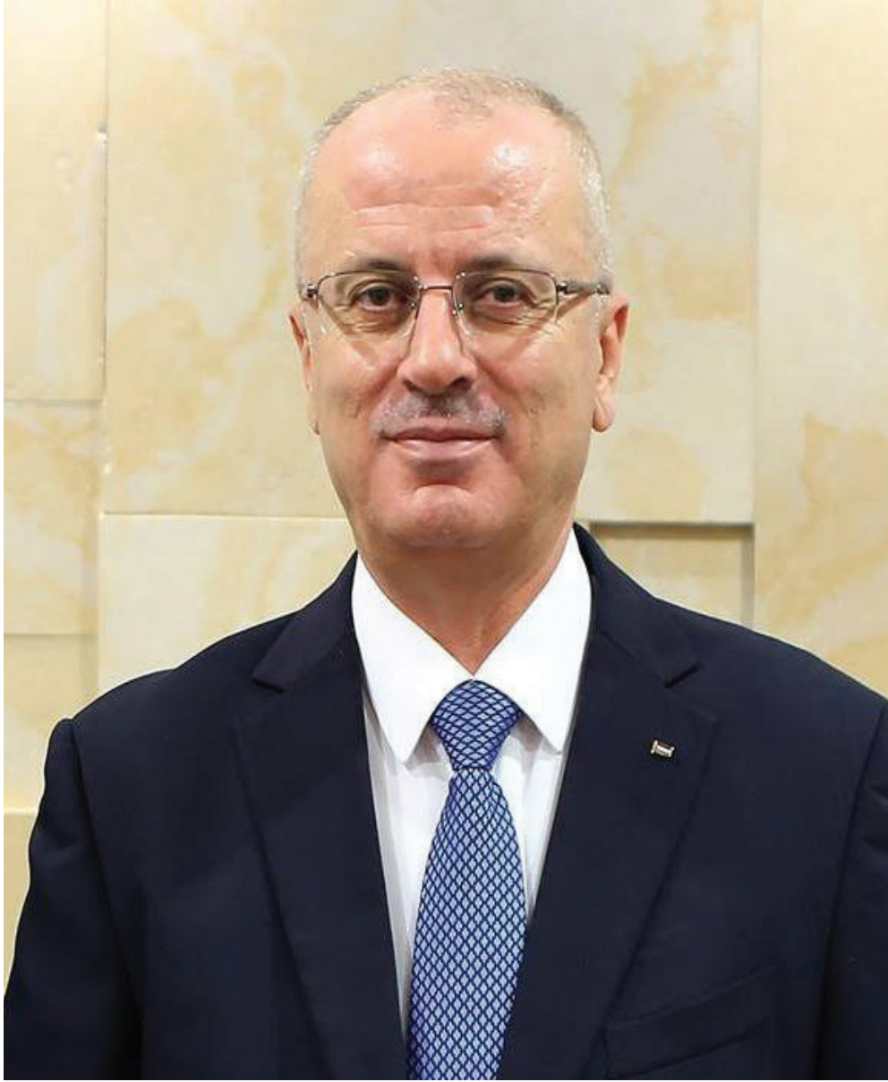
دولة الدكتور رامي الحمد الله رئيس مجلس الوزراء