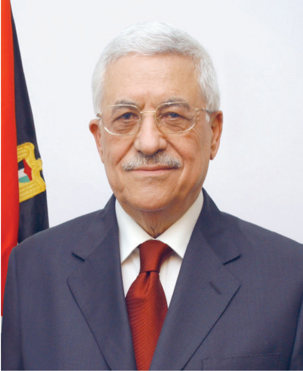
فخامة الرئيس محمود عباس حفظه الله